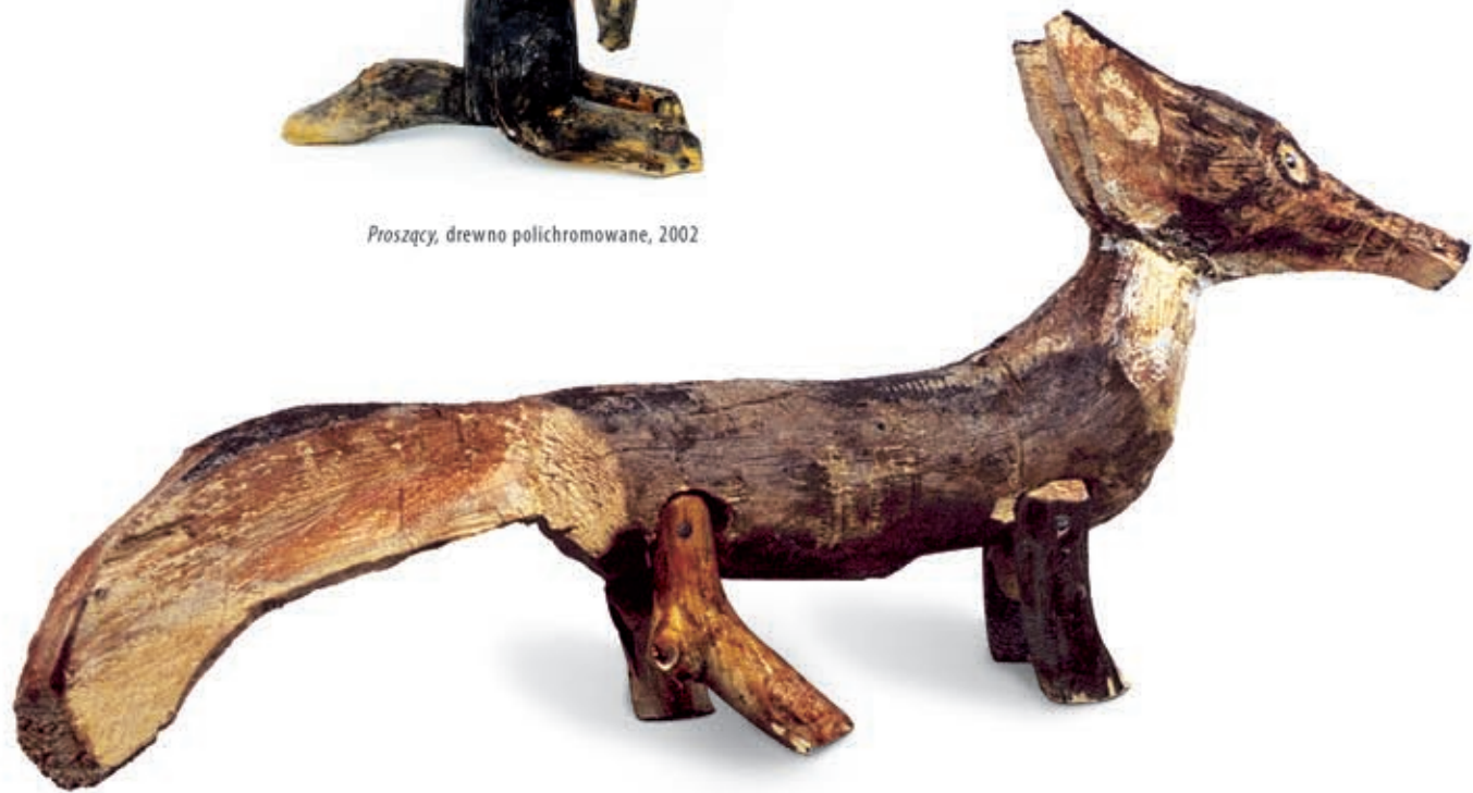
Lisek, drewno, 2002