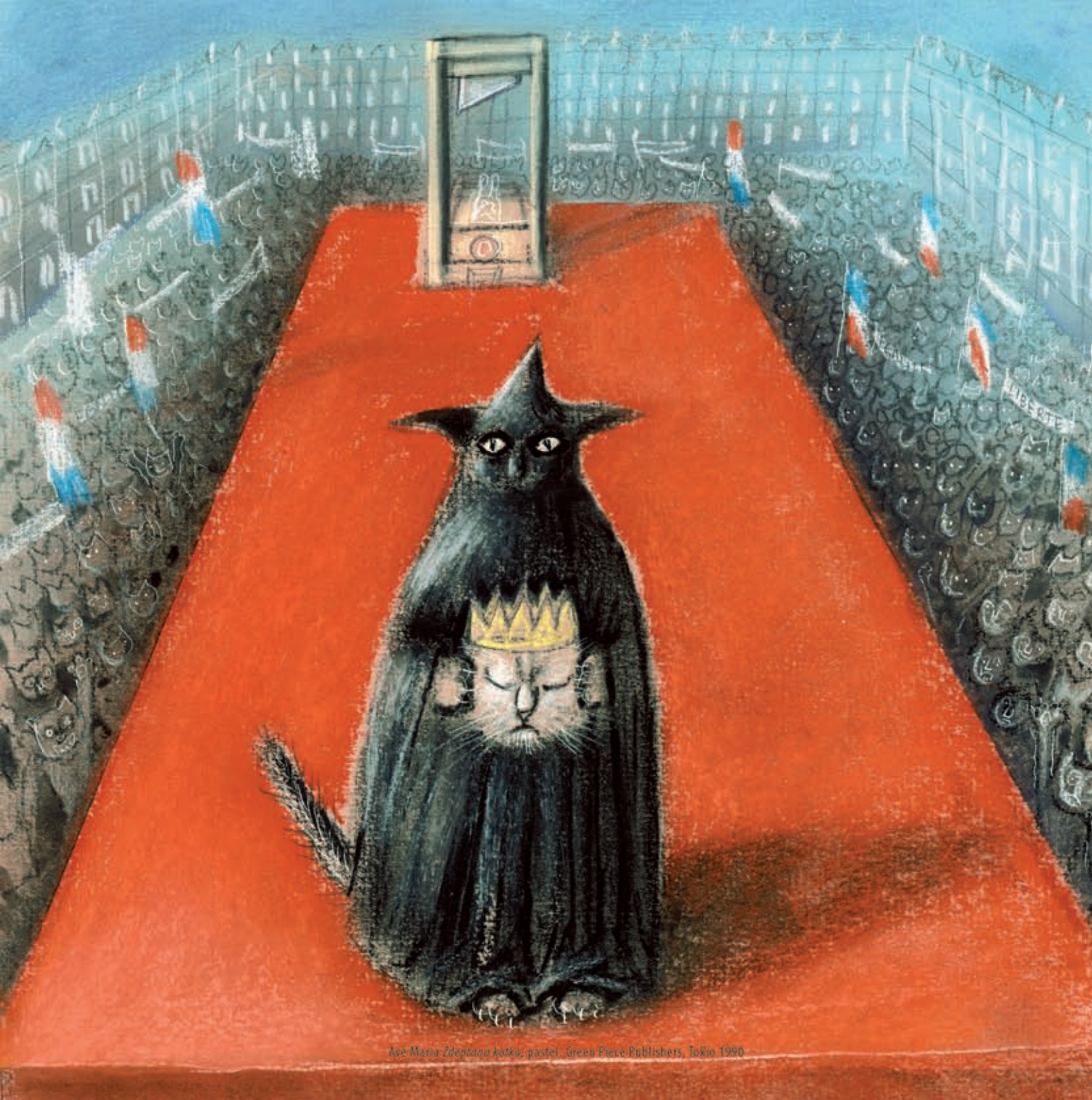
Ave Maria Zdejtana kotka, pastel, Green Piece Publishers, Tokio 1990