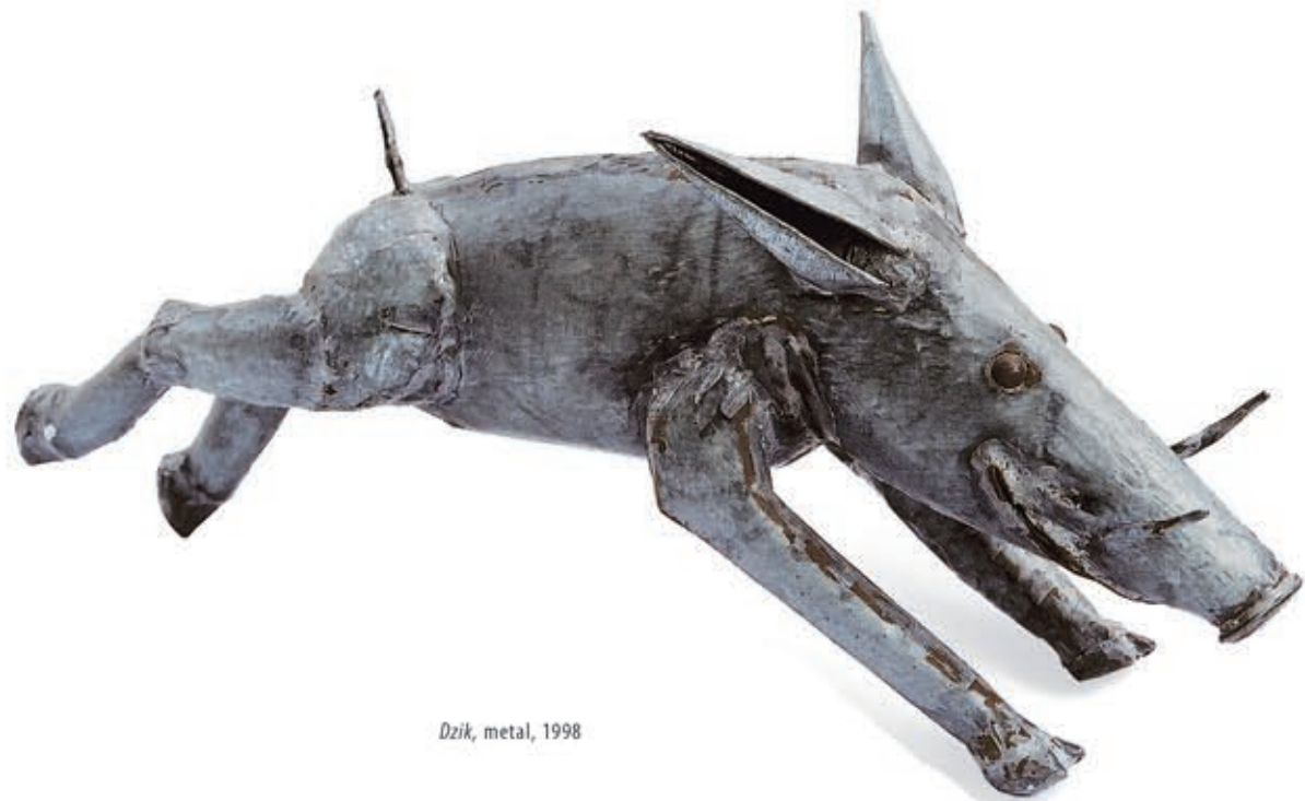
Dzik, metal, 1998