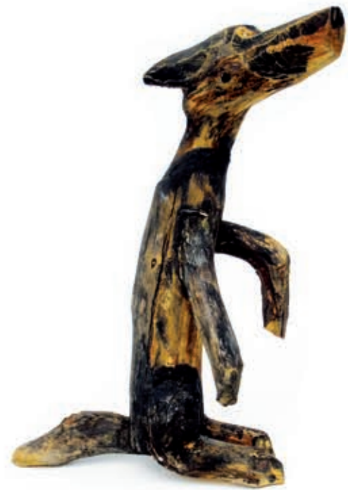
Proszący, drewno polichromowane, 2002