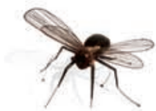
Mucha, metal, 1995