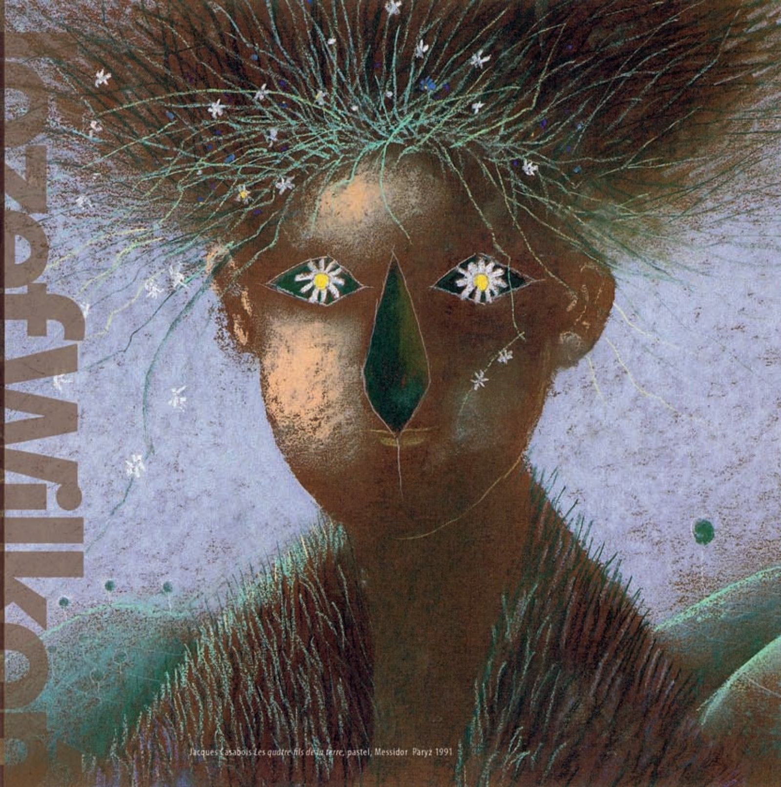
Jacques Casabois - Les quatre fils de la terre, pastel, Messidor - Paryz 1991