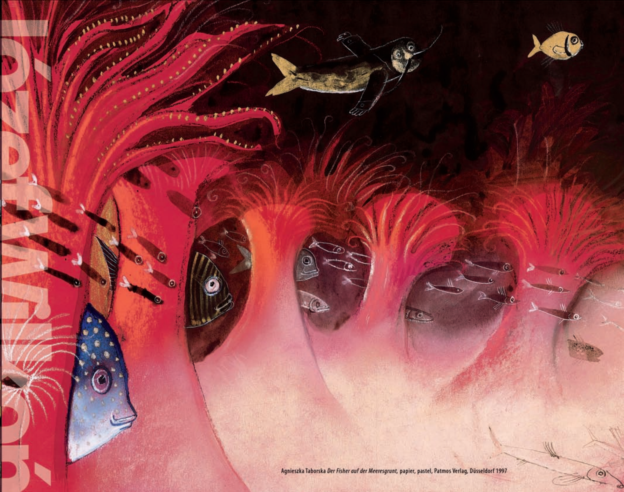
Agnieszka Taborska Der Fisher auf der Meeresgrunt , papier, pastel, Patmos Verlag, Düsseldorf 1997