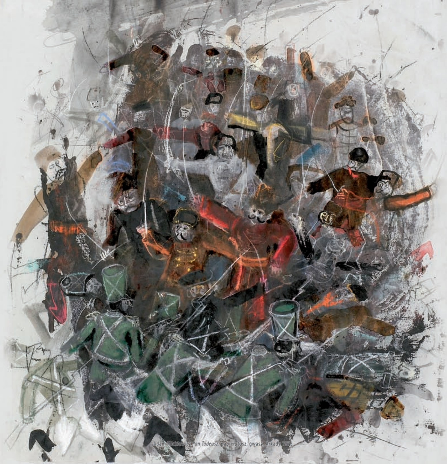
Adam Mickiewicz Pan Tadeusz, papier, tusz, gwasz, Arkady 1973