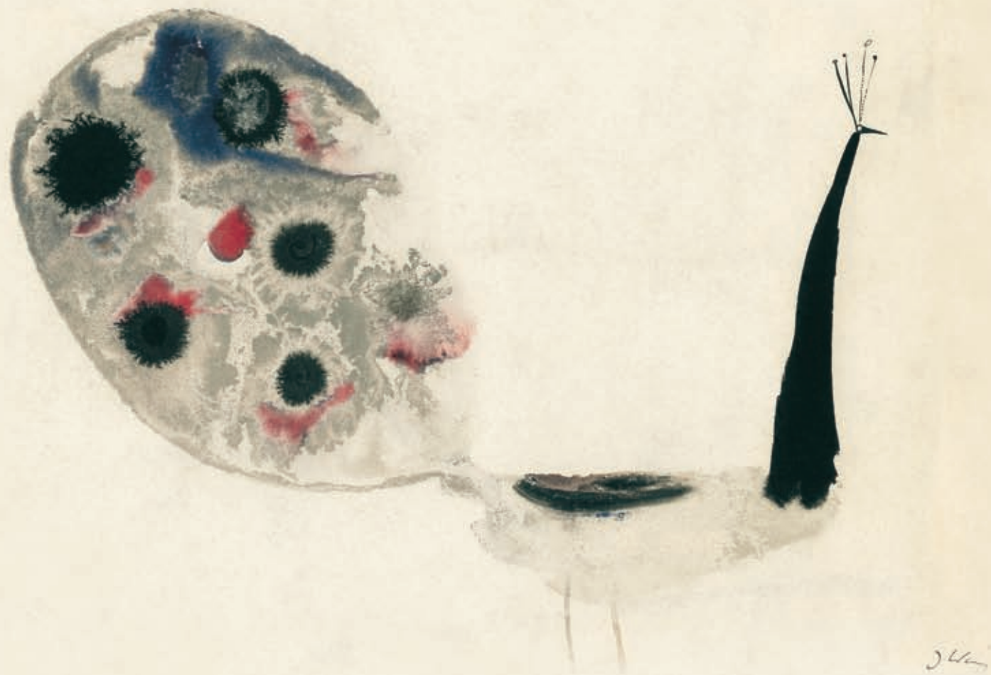
Tadeusz Kubiak Pawie wiersze , papier, tusz, gwasz, Nasza Księgarnia 1959