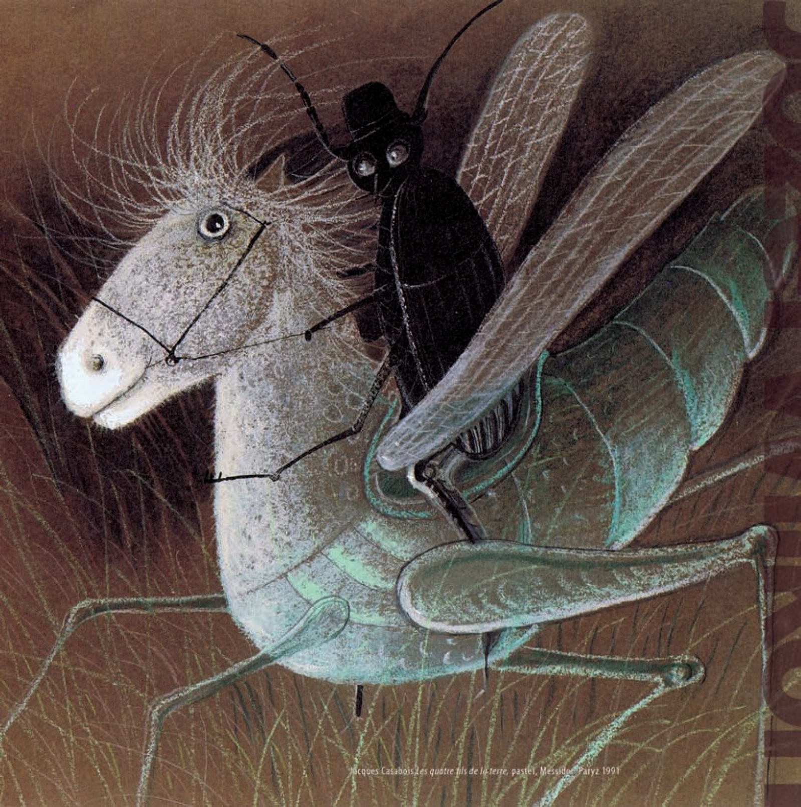
Jacques Casabois - Les quatre fils de la terre, pastel, Messidor - Paryz 1991