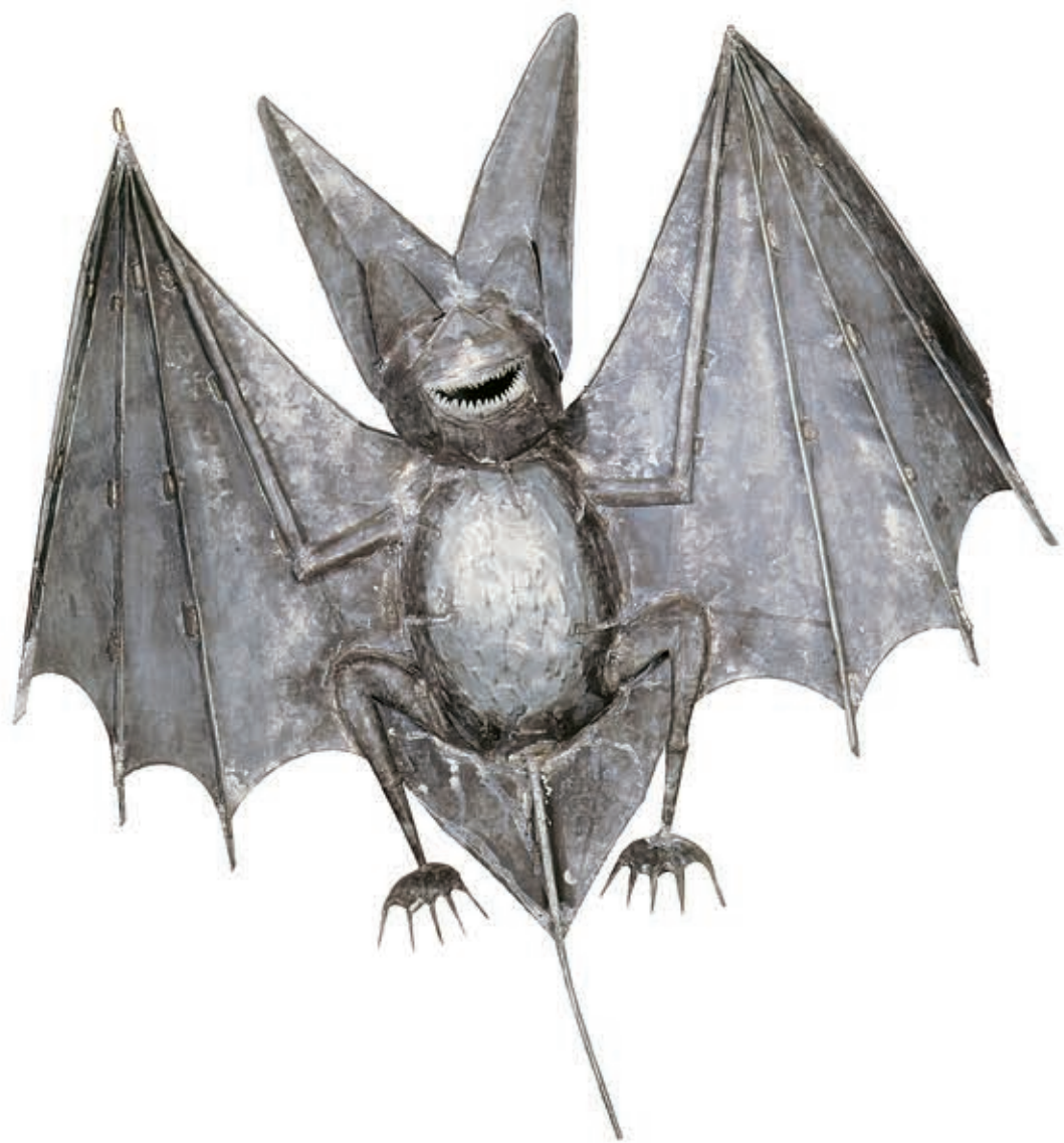
Nietoperz I, metal, 1998