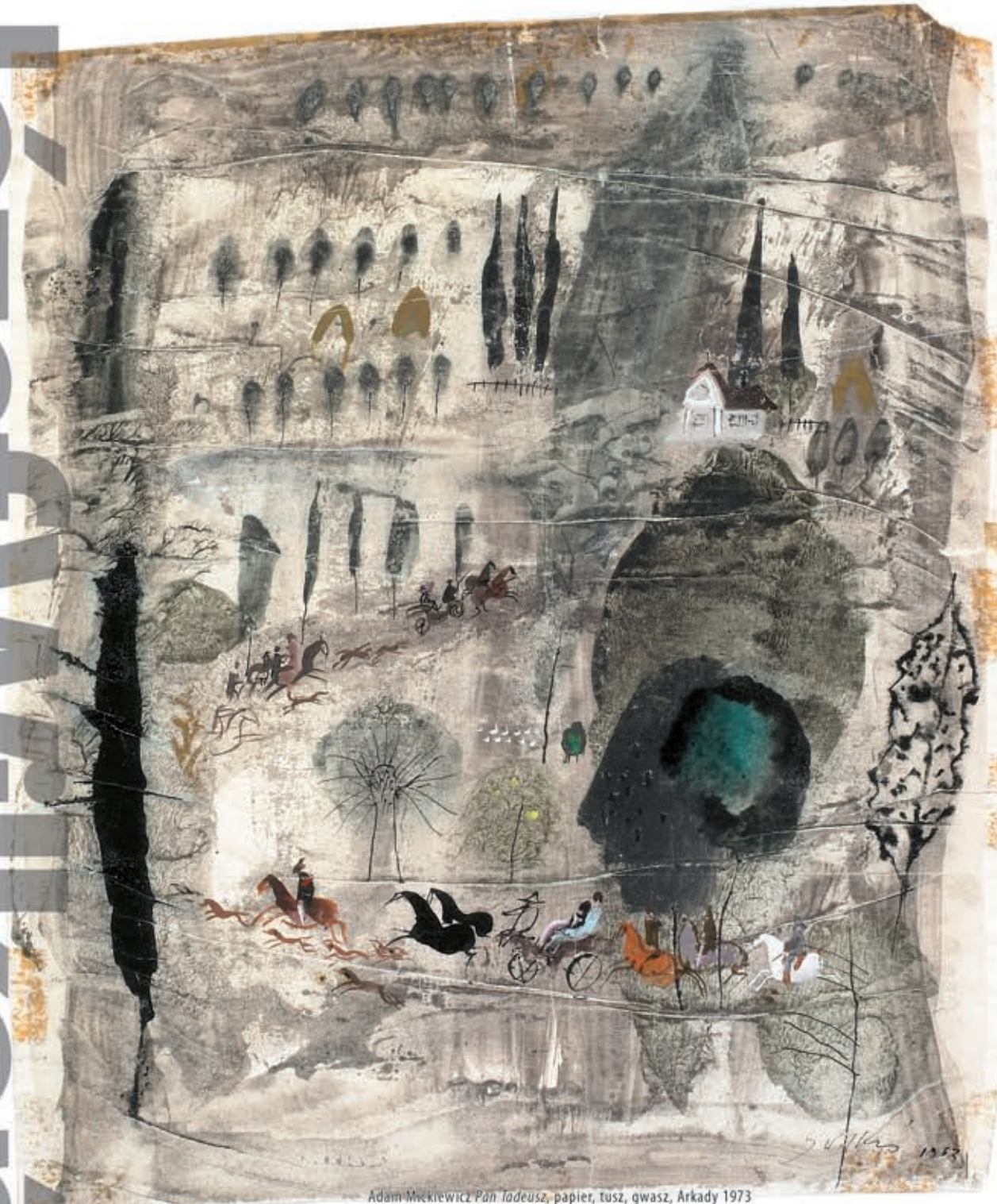
Adam Mickiewicz Pan Tadeusz, papier, tusz, gwasz, Arkady 1973