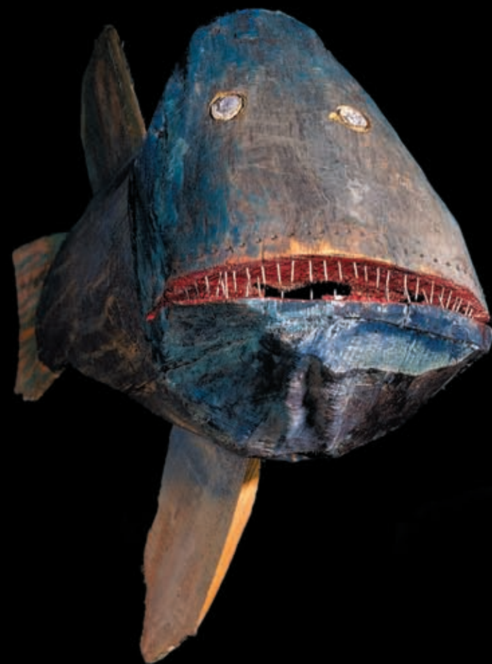
Chimera, drewno polichromowane, 1994