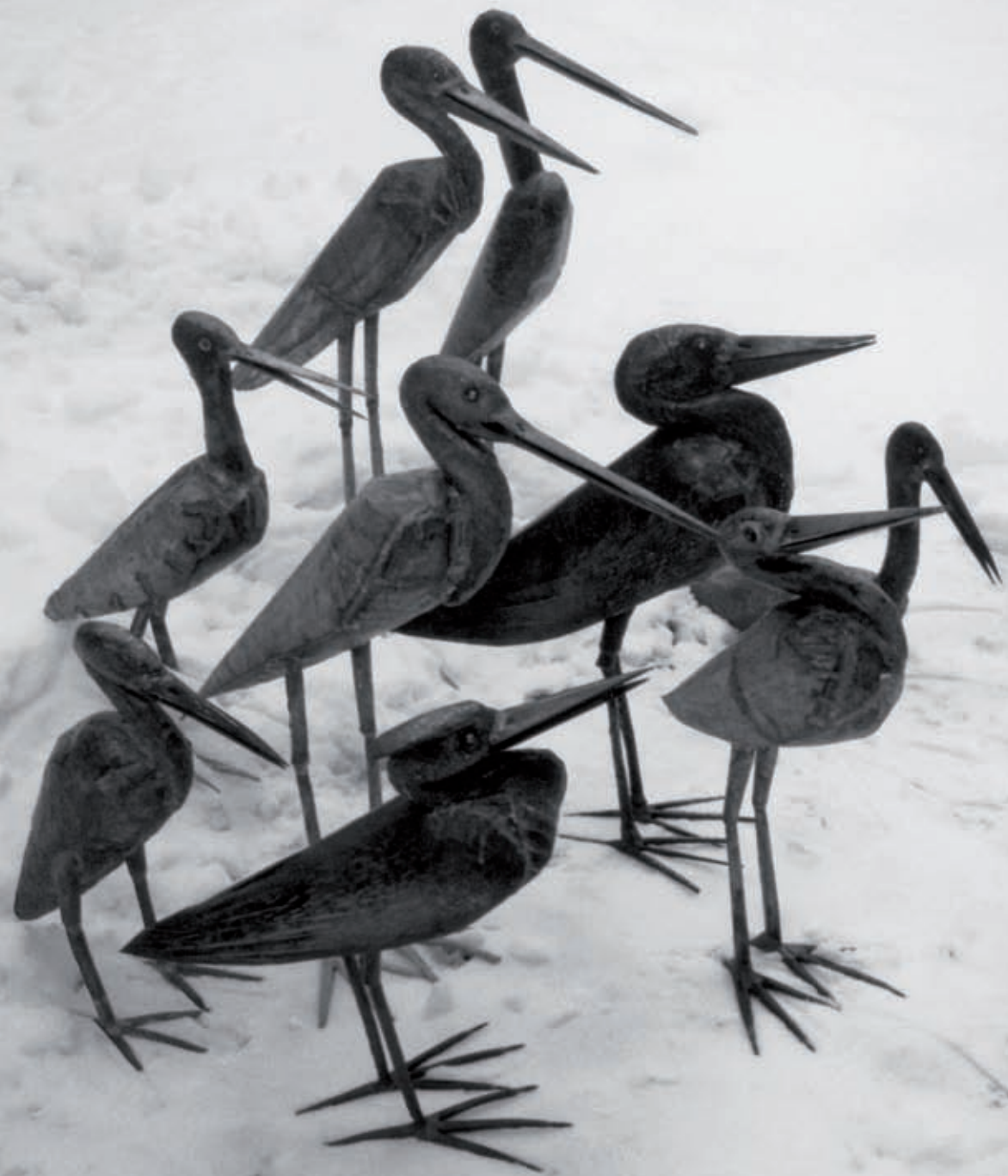
Czaple, metal, 1994