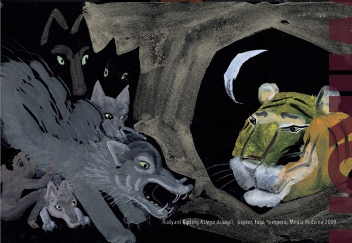
Rudyard Kipling Księga dżungli , papier, tusz, tempera, Media Rodzina 2009