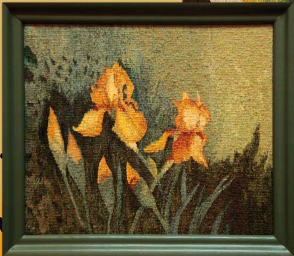
irysy (66x76 cm)