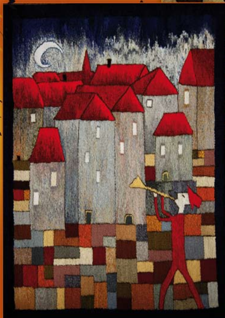
trębacz ( 75x53 cm)