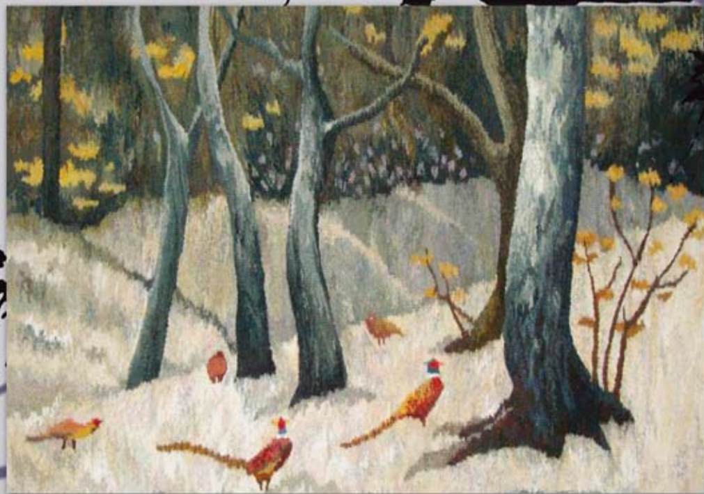
zima (96x66 cm)