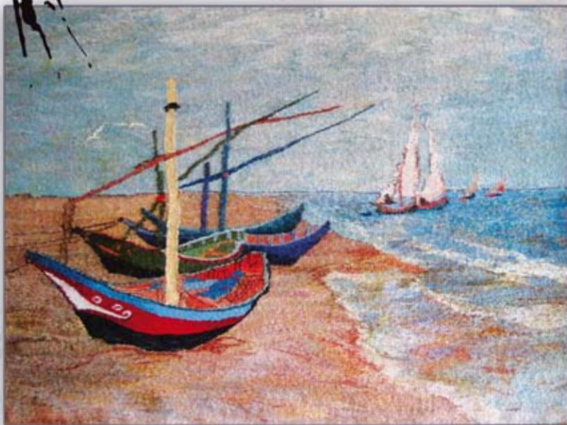
barki na morzu wg Van Gogha (79x58 cm)

Mój dorobek to siedem gobelinów. Cztery z nich zostały wyróżnione. Cieszę się swoimi pracami, ale zawsze mam pewne wątpliwości, czy nie można było lepiej.