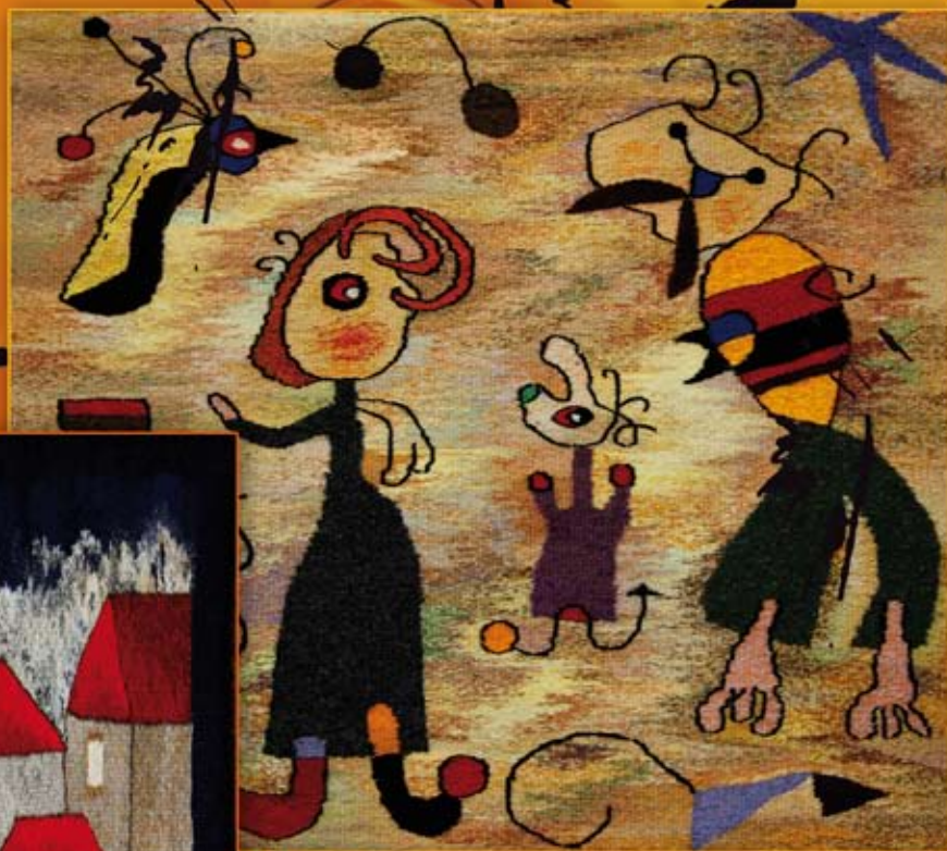
nadzieja II ( 64x72 cm)

Zajęcia w Pracowni tkactwa w Domu Kultury „Zacisze” rozpoczęłam jeszcze pracując w służbie zdrowia. Traktowałam je jako lek na stres od pracy i trudności dnia codziennego. Znalazłam tu spokój i bardzo miłą atmosferę, jak w licznej rodzinie. Kocham ludzi i kocham swoje gobeliny. Często patrzę na nie i za każdym razem odczuwam i widzę coś nowego. Ostatnio doszłam do wniosku, że za późno rozpoczęłam. Mogłabym jeszcze więcej przekazać w swoich pracach.