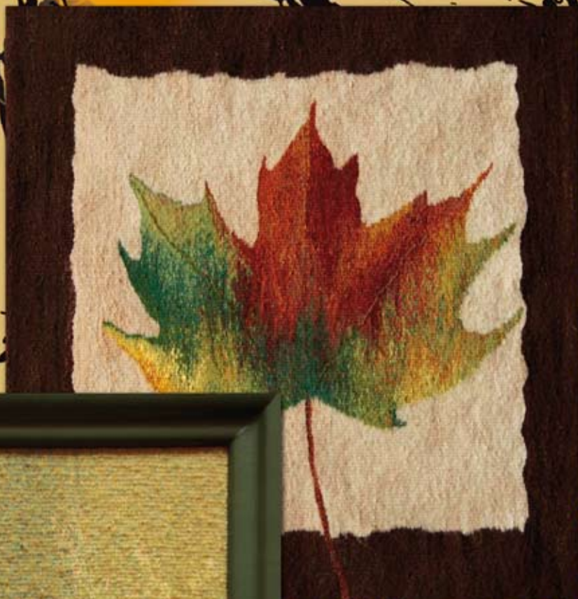
liść (66x83 cm)

Trafiłam do pracowni tkactwa na Zaciszu. Odnalazłam tu relaks i spełniłam moje marzenia.