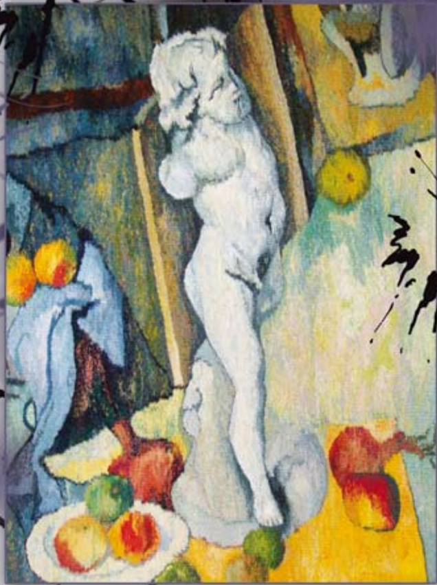
amorek wg Cezanna (62x80 cm)