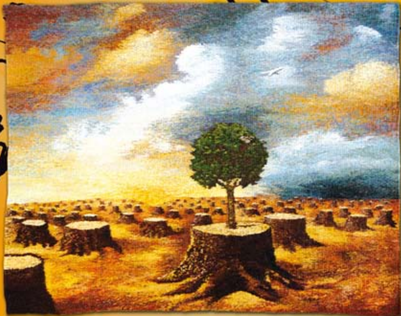
nadzieja (80x60 cm)