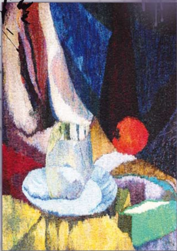
martwa natura (65x70 cm)