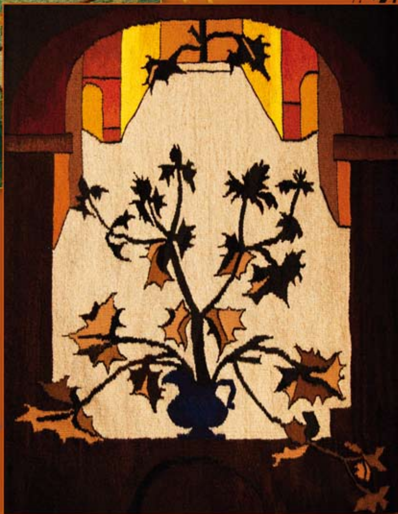
osty ( 81x105 cm)