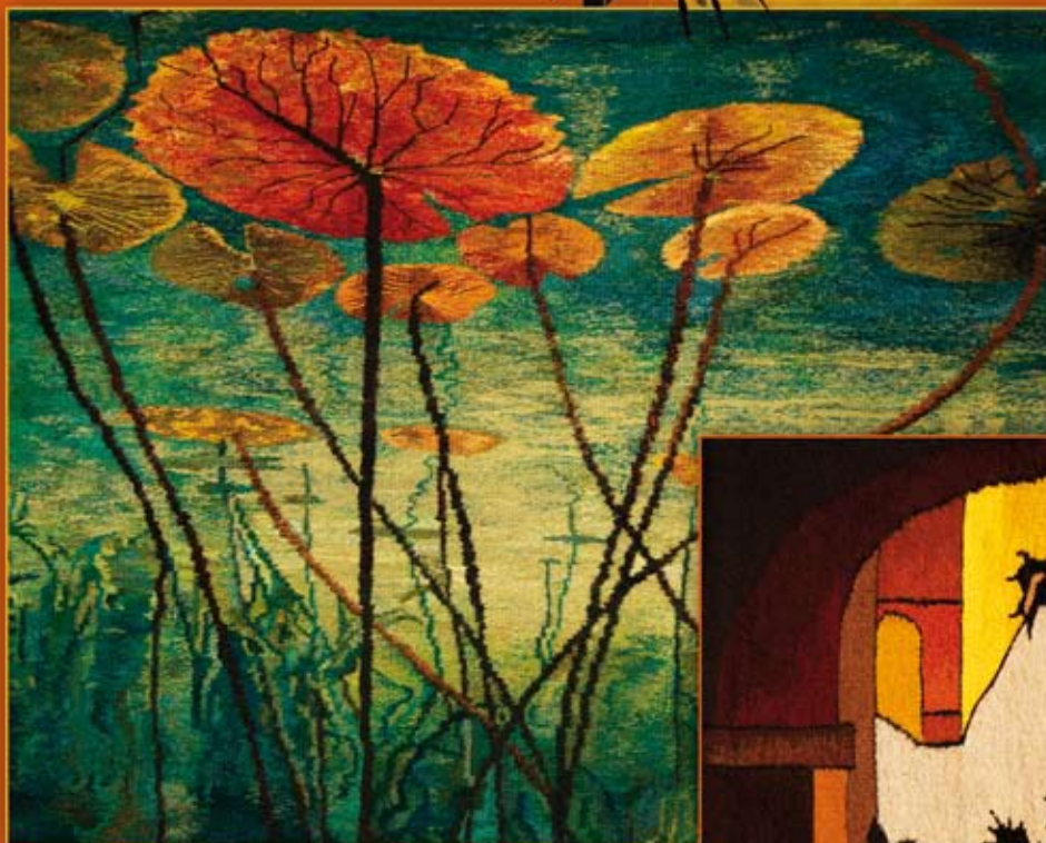
podwodny ogród ( 95x76 cm)